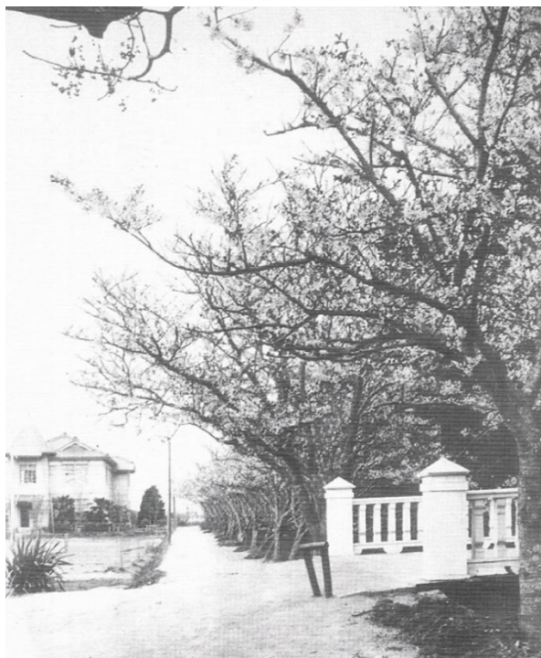
桜咲く有始有終橋（安城市池浦町・昭和10年）

本館正面玄関前にある有始有終橋は同校の創立精神を伝えるものとして名付けられた。姿形は変えつつも今も昔と変わることなく同校の歴史を亭々として語り続けている。