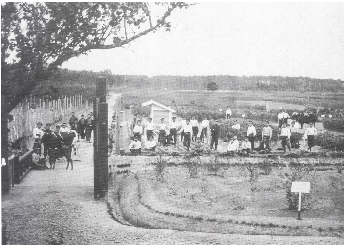
実習農場で恩師と記念撮影（安城市池浦町・明治37年）

本館正面玄関前にある有始有終橋は同校の創立精神を伝えるものとして名付けられた。姿形は変えつつも今も昔と変わることなく同校の歴史を亭々として語り続けている。