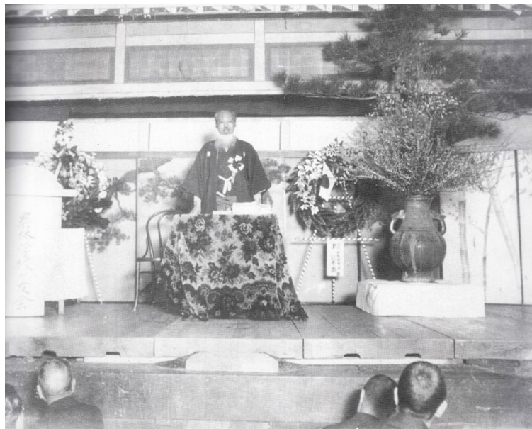
山崎延吉の名講演会を聴く（安城市・大正末年）

同時に、安城農林学校は、農民、農村教育の場ともされ、県下農村文化の源泉となり、日本のデンマークをリードした。