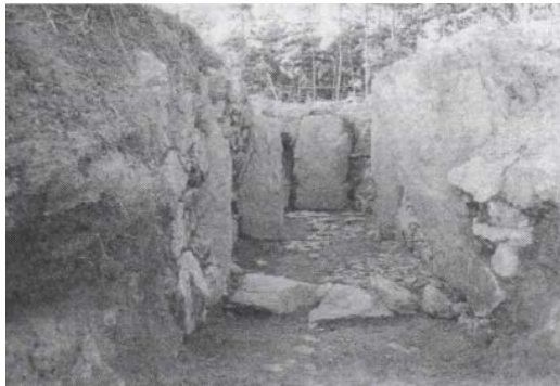
住崎1号墳の石室入口（発掘時）