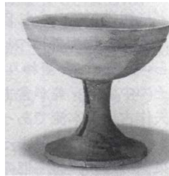
住崎1号墳の出土品（須恵器）