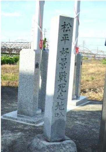
松平好景の碑案内 1922(大正11)年建立 20150818