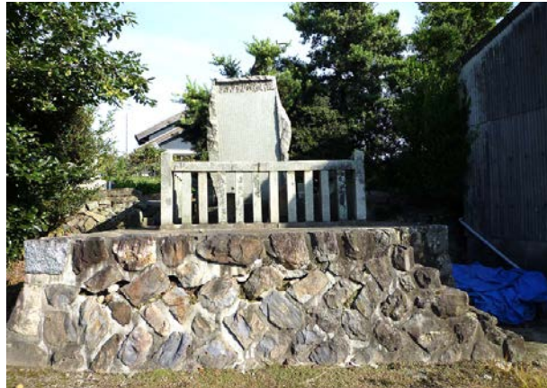
松平好景の碑 1872(明治5)年建立 20150818