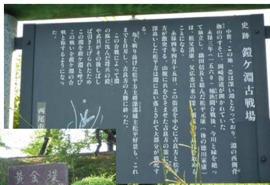
鎧ヶ淵古戦場案内 20150818