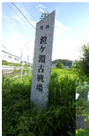
鎧ヶ淵古戦場の碑 20150818