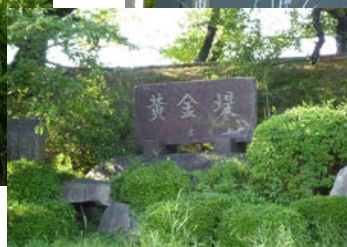
鎧ヶ淵古戦場：西尾市善明町