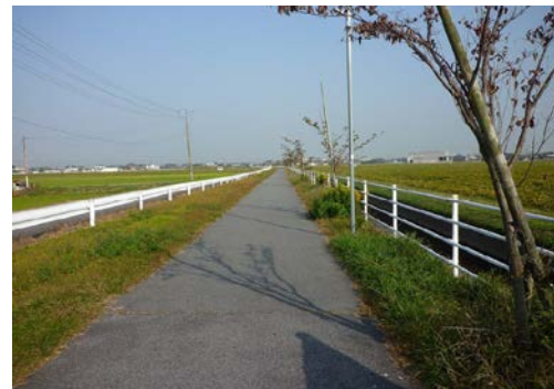
高橋用西側を望む 20151020