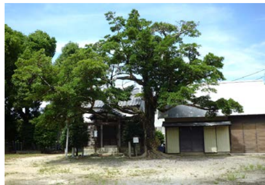
八幡神社 招霊木の木 20150727