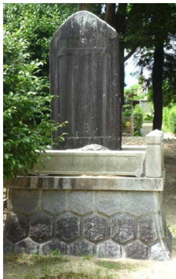
大正宮鎮座記念碑 20150727