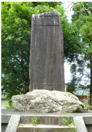
耕地整理記念碑 20150727 1905（明治38）年建立