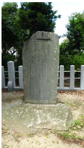
神饌幣帛料供進神社指定の碑 20150727