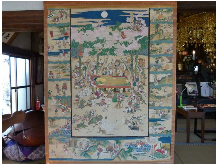
岡崎市指定文化財 涅槃図