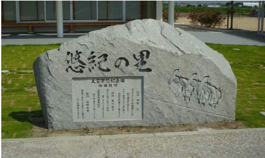
斎田地の記念碑 大嘗祭悠紀斎田 御田植唄 2013(平成25)年 20150731