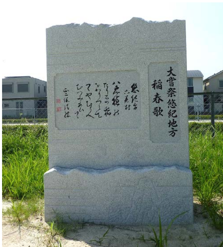
齋田地の記念碑表 大嘗祭悠紀地方 稻舂歌 20150731