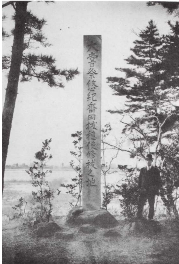
悠紀齋田修祓地の碑 六ッ美村誌より転写