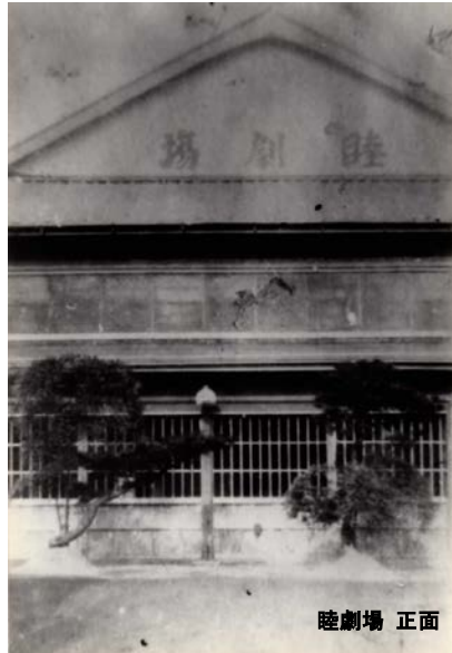
陸劇場 正面 1917(昭和6)年興業許可 1936(昭和11)年撮影