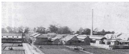
杉浦製糸所外観 現在の小学校付近からの遠望1940年頃